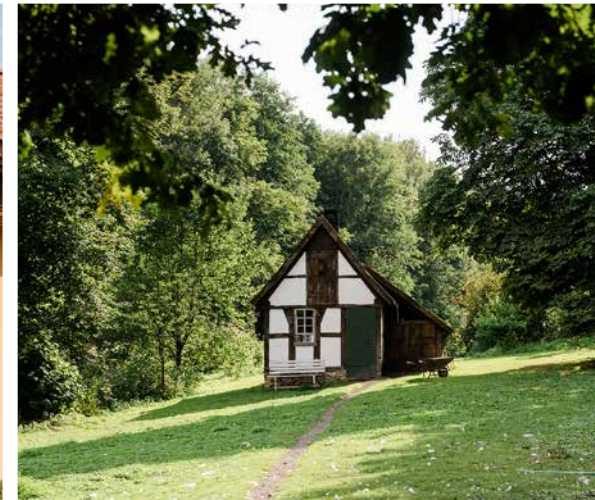
Startpunkt Campingpark Kalletal Starting Point